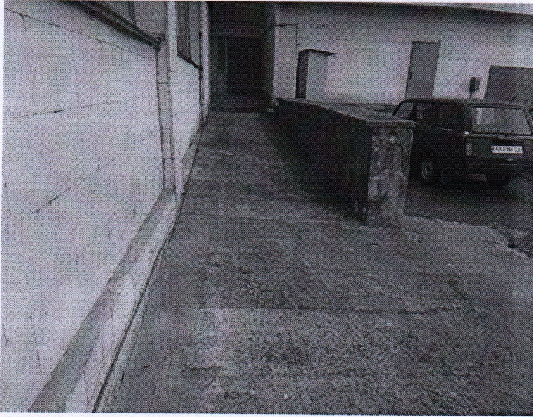
Рис. 2. Фото пандусу подвір'я.