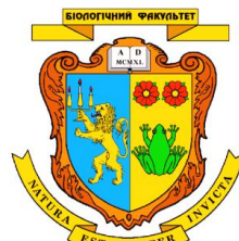
Біологічний факультет Львівського національного університету імені Івана Франка