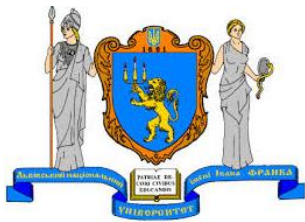
Львівський національний університет імені Івана Франка

Організаторами конференції є біологічний факультет Львівського національного університету імені Івана Франка, Товариство прихильників Львівського університету, Українське біофізичне товариство, Українське фізіологічне товариство імені П. Костюка, Міністерство освіти і науки України та Інститут біології та охорони середовища Поморської Академії в Слупську (Польща).